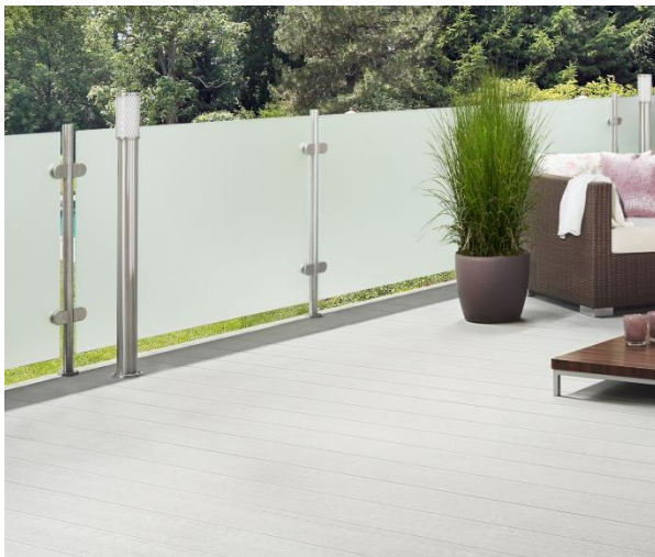
Pinuform DGP 230 cl, coloris gris clair, 25 x 175 mm

MOCOPINUS propose également une gamme PINUFORM plus large avec des profils d'une largeur de 175mm. Ces produits ne font pas partie de la gamme PINUFIX, mais disposent d'aspects de surface plus variés. Le grand avantage des lames en bois-polymère est qu'elles ne s'écaillent pas, ce qui rend la terrasse très agréable aux pieds nus. En plus d'une facilité d'entretien, ce matériau possède une bonne résistance aux agents extérieurs, une surface antidérapante et une stabilité dimensionnelle. Les produits de la gamme PINUFORM proposés par MOCOPINUS sont de haute qualité et disposent d'une garantie de 10 ans. Le matériau PINUFORM est 100 % recyclable et préserve l'environnement en capturant le CO 2 .