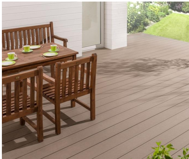
Pinuform DGP 230 cl, coloris brun foncé, 25 x 175 mm