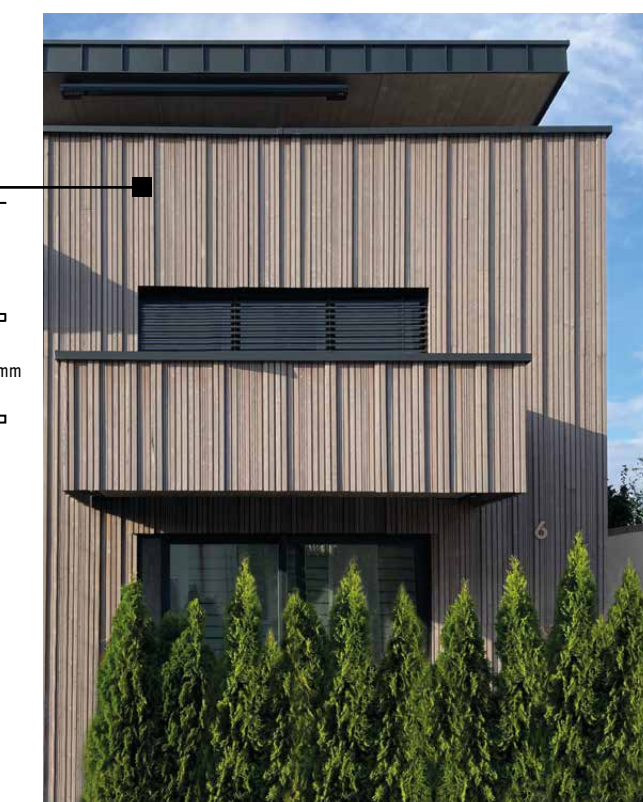
Lignosil®-Verano 4880 Mélèze de Sibérie R3D 00 1n hf 27 / 44 x 144 (120) mm R3D 00 3n hf 27 x 144 (120) mm