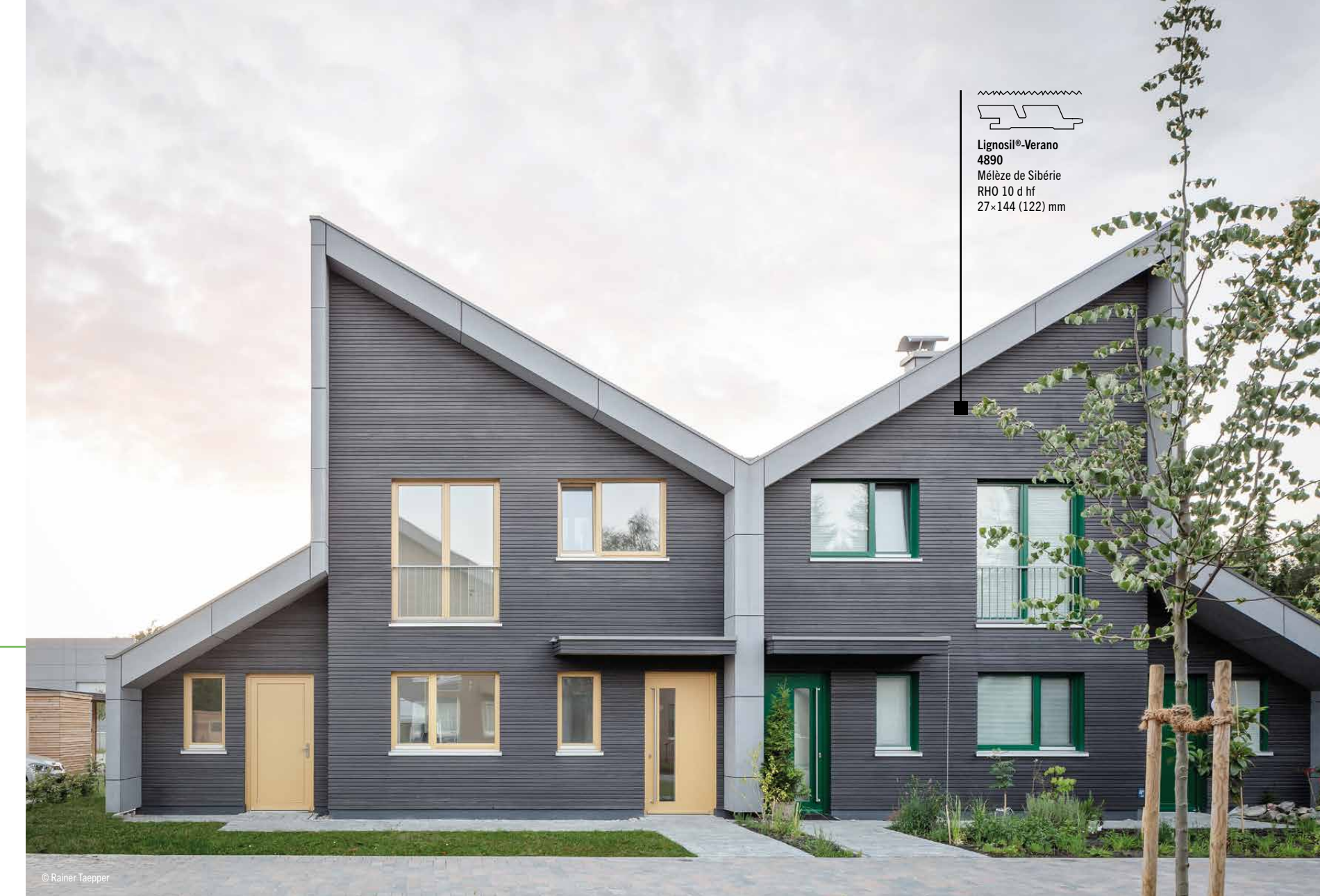
Lignosil®-Verano 4890 Mélèze de Sibérie RHO 10 d hf 27 x 144 (122) mm