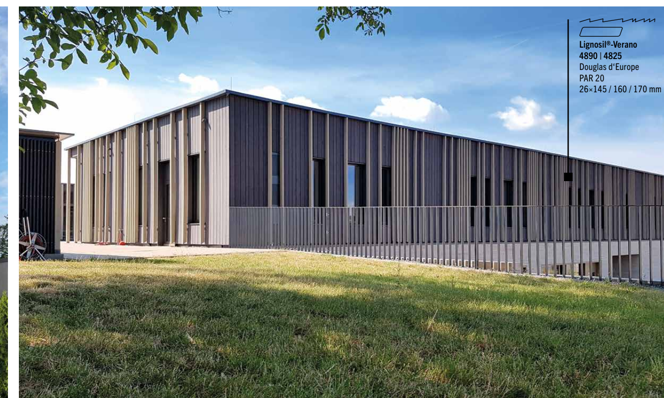
Lignosil®-Verano 4890 | 4825 Douglas d'Europe PAR 20 26 x 145 / 160 / 170 mm