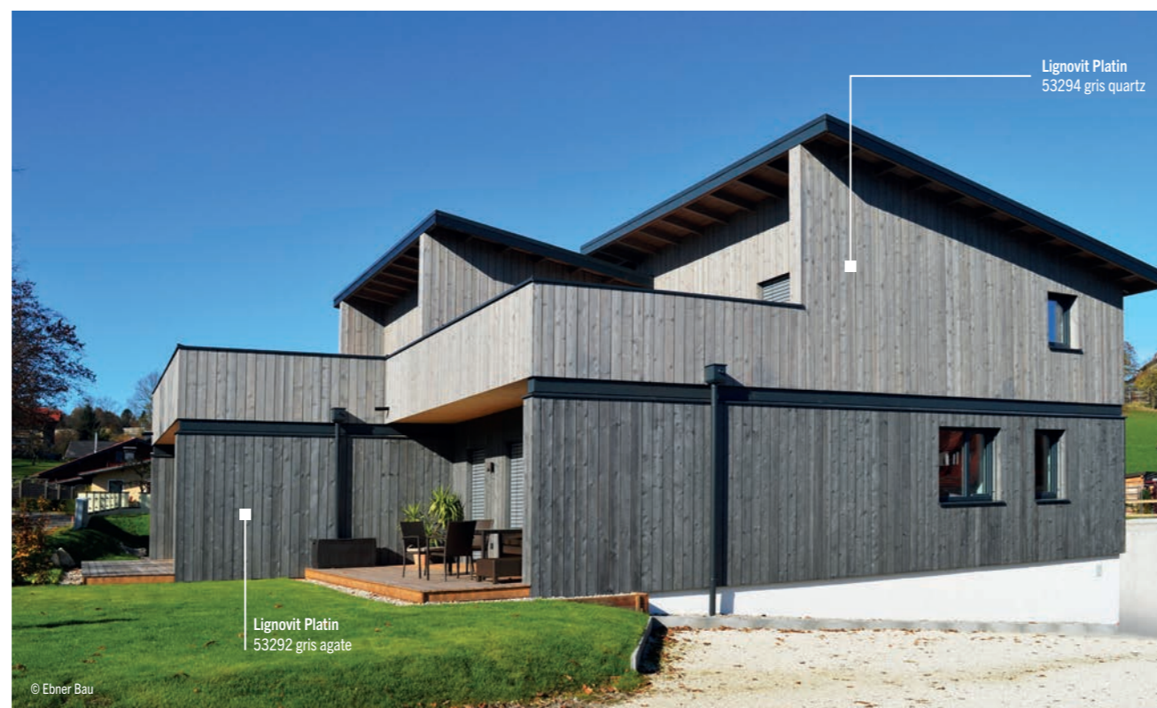
Lignovit Platin 53294 gris quartz