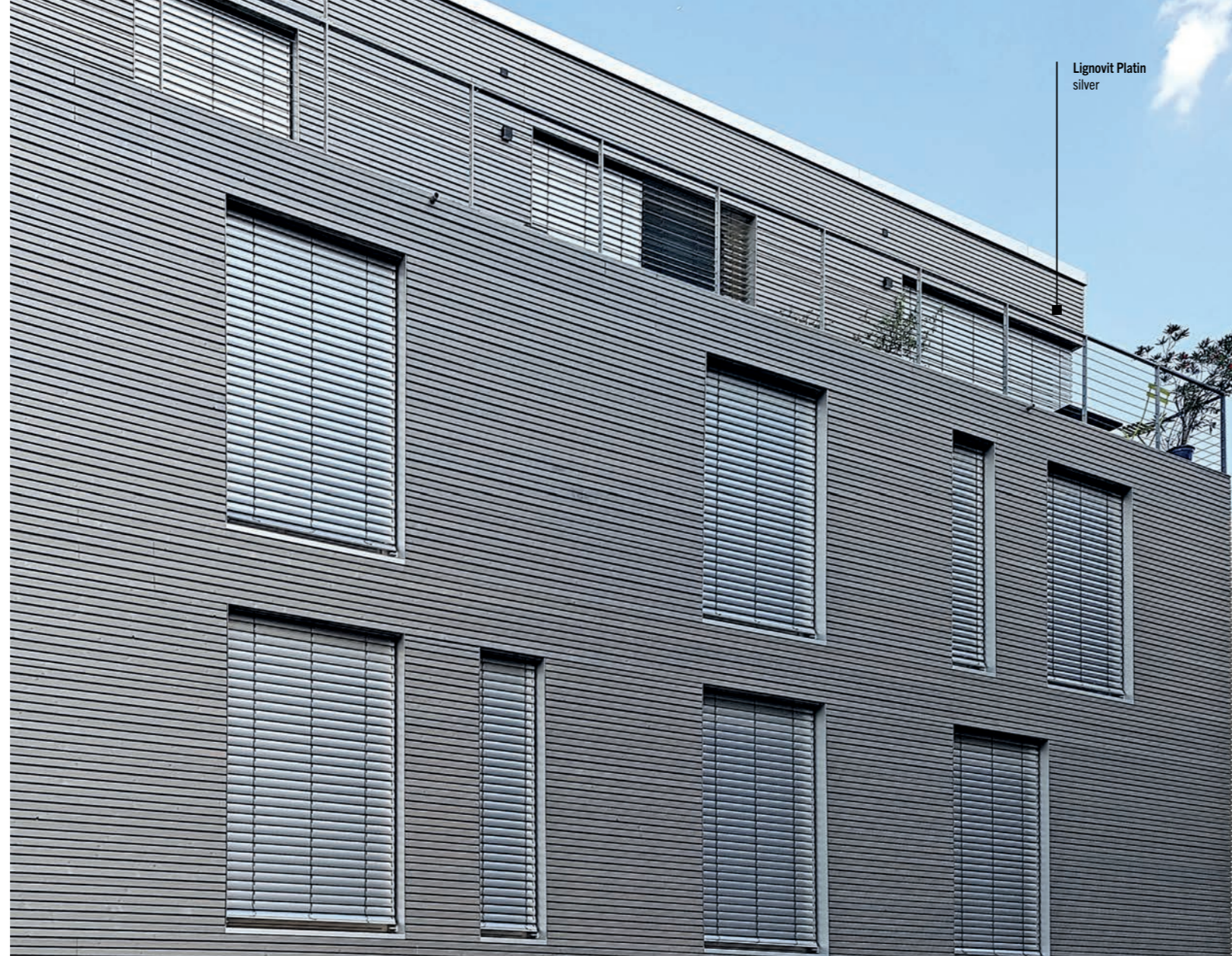
Lignovit Platin silver