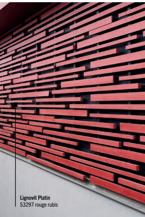
Lignovit Platin 53297 rouge rubis